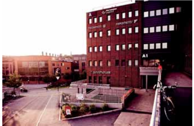
Myrens verksted, dawna kuźnia, Oslo Myrens verksted, former smithy, Oslo