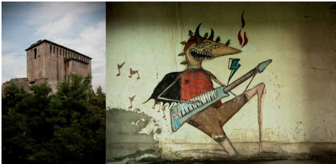
Prefabet, Nowa Huta, Kraków Prefabet Company, Nowa Huta, Kraków