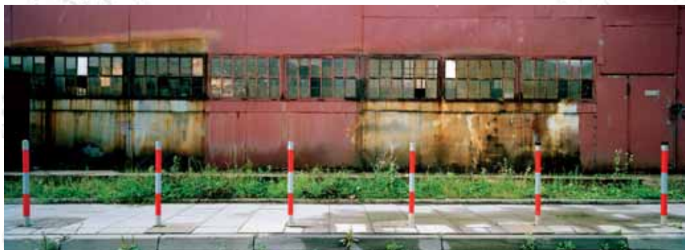
Dawne warsztaty, Zabłocie, Kraków Former plants, Zabłocie district, Krakow