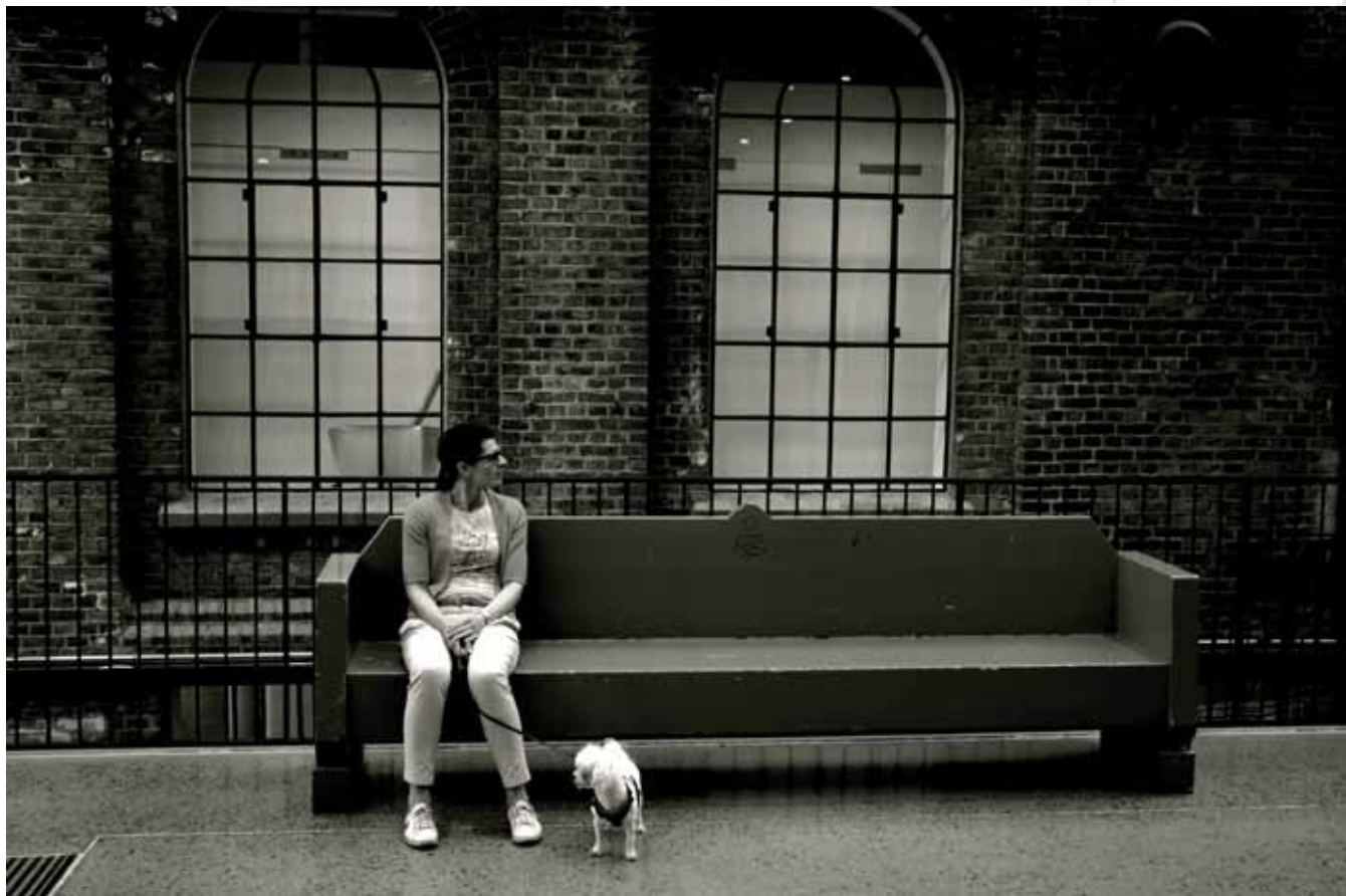
Akademia Sztuk, dawniej fabryka żagli Christiania Seildugsfabrik, Oslo Academy of Arts, former Christiania Seildugsfabrik sail factory, Oslo