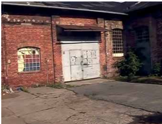
Zabudowania przemysłowe wzdłuż rzeki Akerselva, Oslo Post-industrial buildings alongside the Akerselva river, Oslo