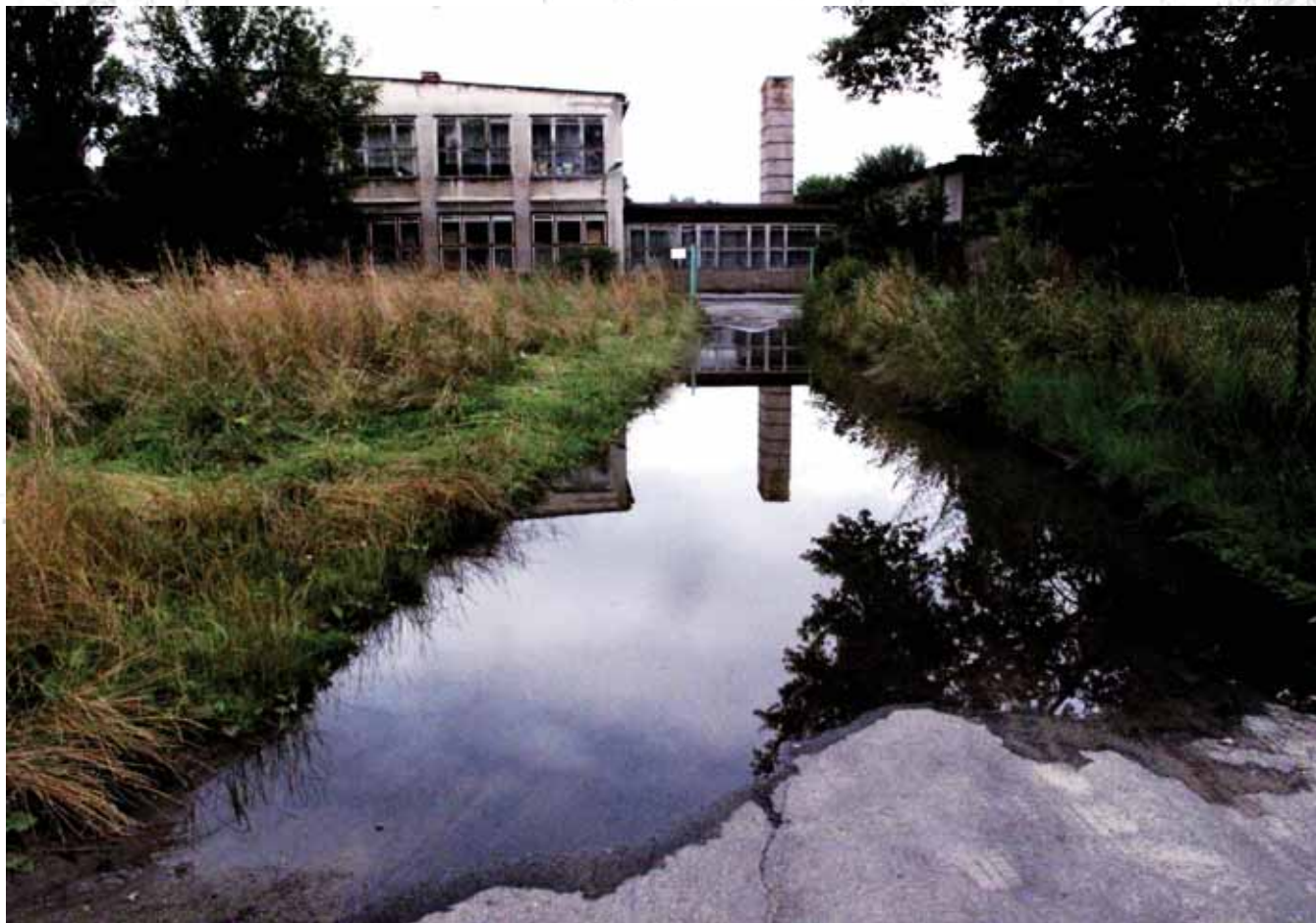
Technikum Odzieżowe, Nowa Huta, Kraków Technical School of Clothing, Nowa Huta, Krakow