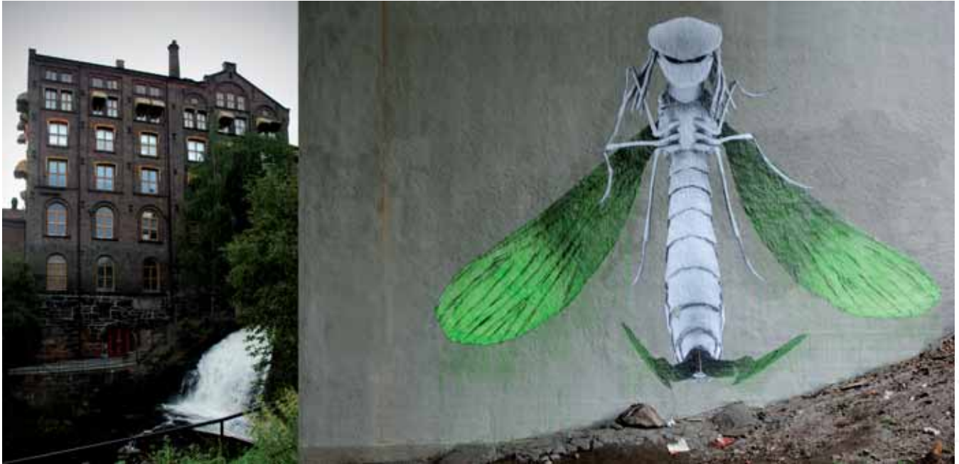
Mieszkania, lokale, biura; dawniej Hjula Væverier, Oslo Flats, outlets, offices; former Hjula Væverier, Oslo