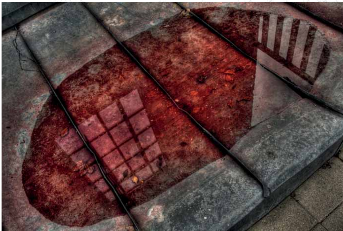
Sklep Mexx, okolice rzeki Akerselva, Oslo Mexx shop, near the river Akerselva, Oslo