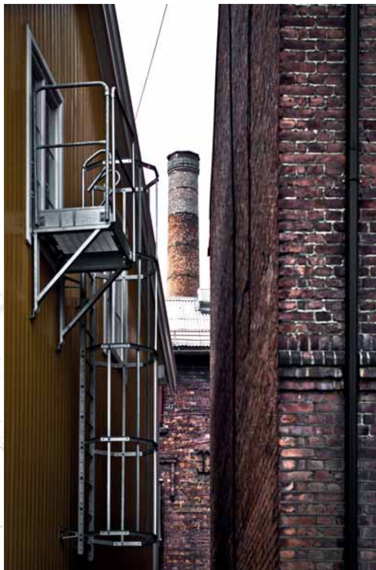
Nydalen, dzielnica poprzemysłowa, Oslo Nydalen, post-industrial district, Oslo