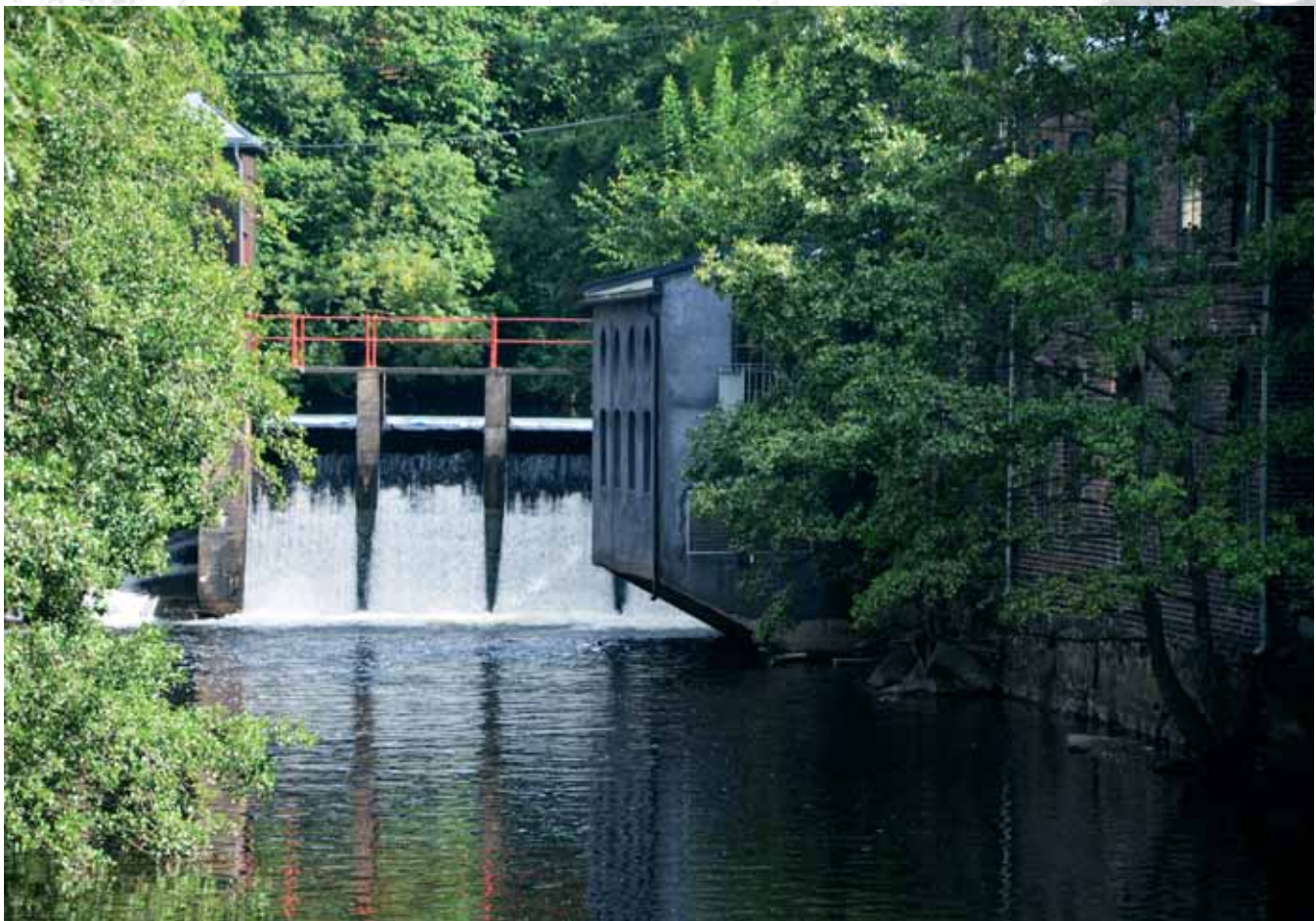
Okolice rzeki Akerselva, Oslo Near the river Akerselva, Oslo