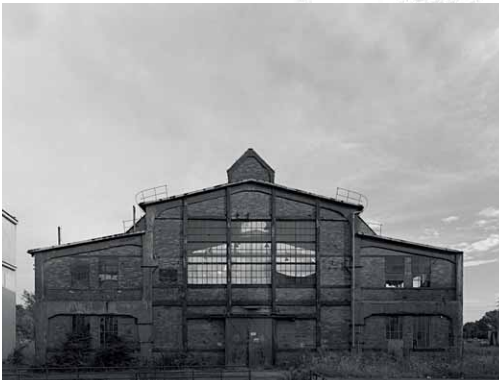
Zakłady Budowy Maszyn i Aparatury im. Ludwika Zieleniewskiego, Kraków Ludwik Zieleniewski Machine and Apparatus Works, Krakow