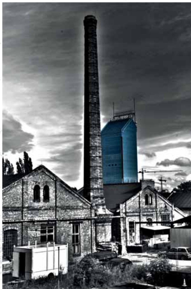
Fabryka Erdal, Kraków Erdal factory, Krakow