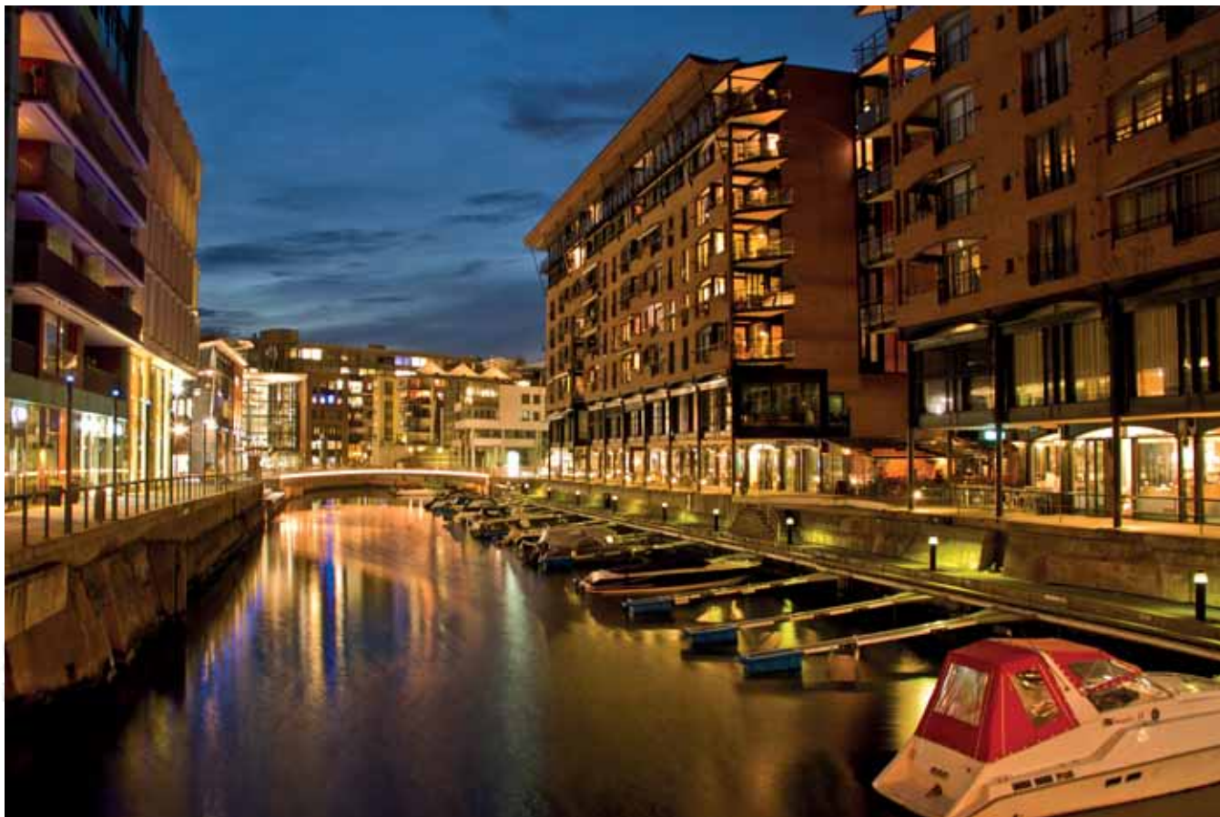
Aker Brygge, dawna stocznia, Oslo Aker Brygge, former shipyard, Oslo