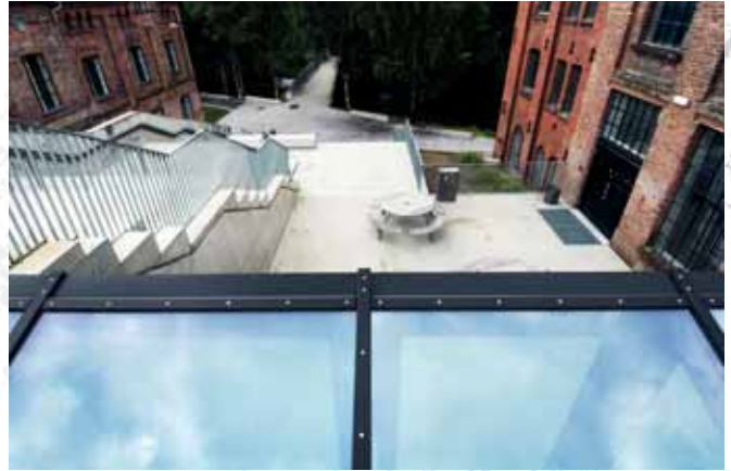
Akademia Sztuk, dawniej fabryka żagli Christiania Seildugsfabrik, Oslo Academy of Arts, former Christiania Seildugsfabrik sail factory, Oslo