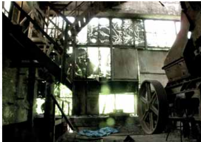
Oddział Żużla Kawatkowego, Nowa Huta, Kraków Lump Slag Shop, Nowa Huta, Krakow