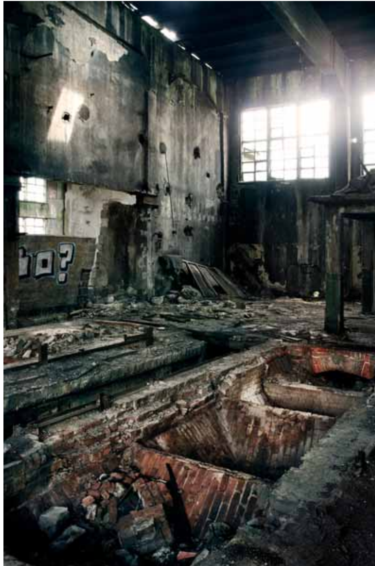
Prefabet, Nowa Huta, Kraków Prefabet Company, Nowa Huta, Krakow