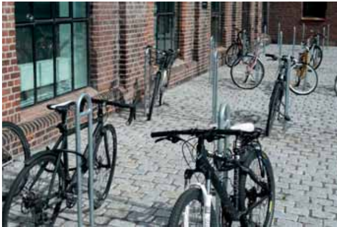
Centrum Architektury i Designu DogA, Oslo DogA – The Norwegian Centre for Design and Architecture, Oslo