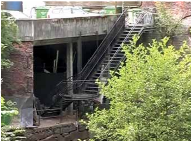
Dawne warsztaty, Månefisker Club, Oslo Former plants, Månefisker Club, Oslo