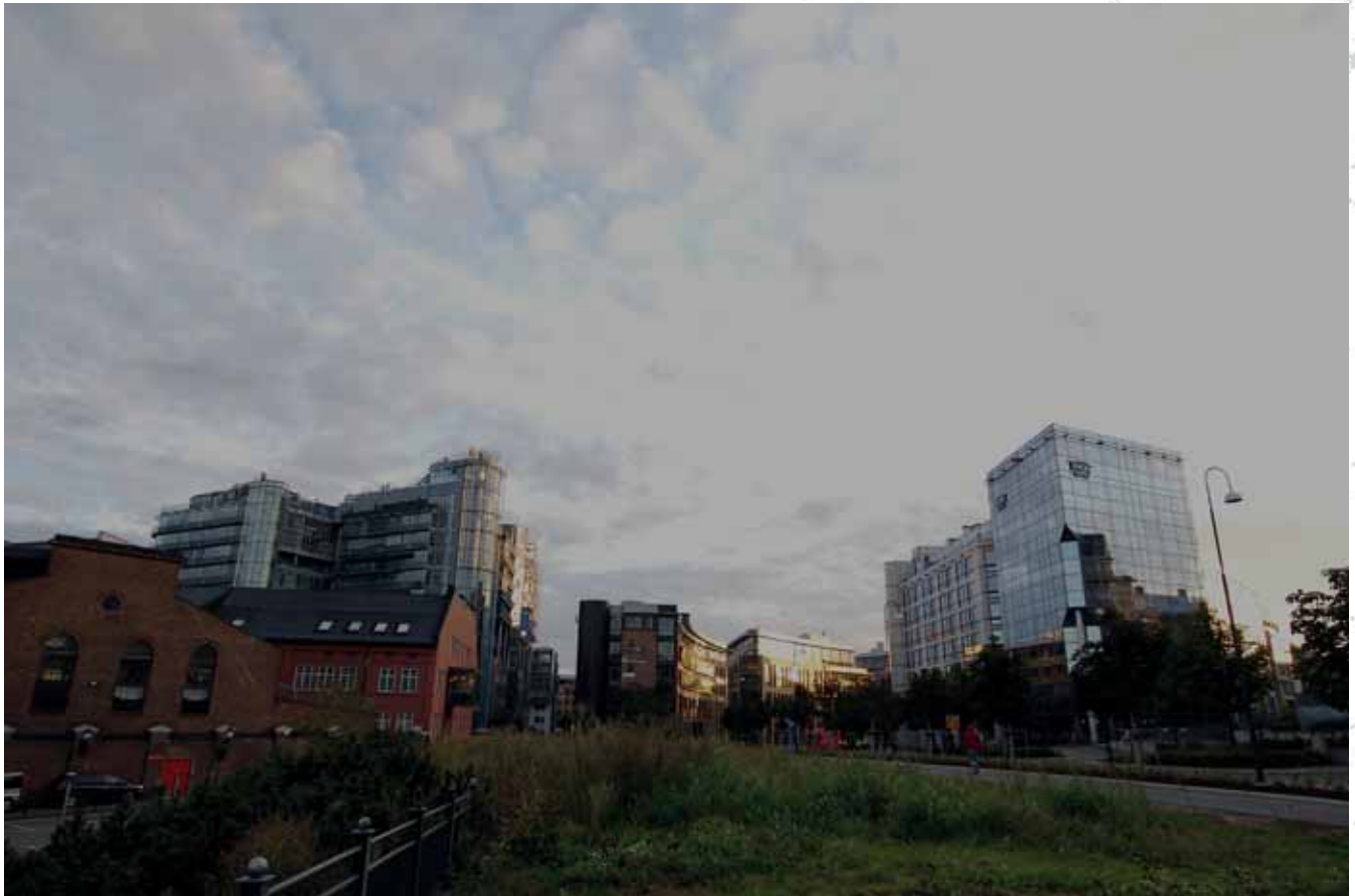
Warsztaty mechaniczne Thunes, Oslo Thunes Mechanical Workshops, Oslo