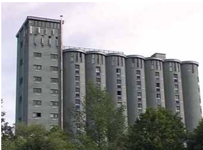
Dawne silosy na zboże przekształcone na akademiki, Maridalsveien, Oslo Old grain storage converted to student housing, Maridalsveien, Oslo