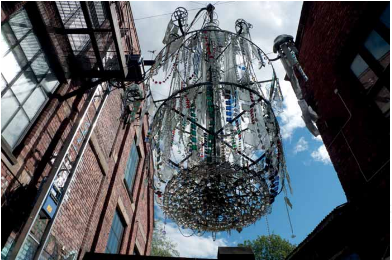
Kulturhuset Hausmania V, dom kultury, Oslo Kulturhuset Hausmania V, the cultural house, Oslo