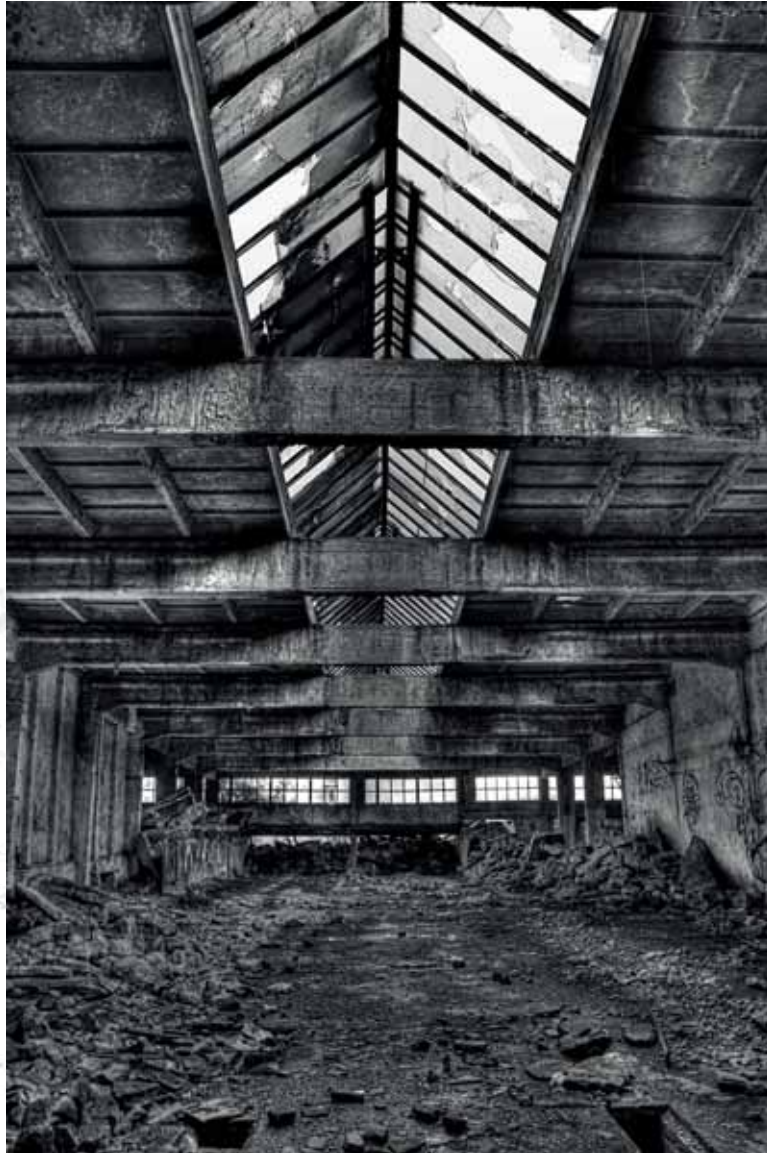
Prefabet, Nowa Huta, Kraków Prefabet Company, Nowa Huta, Krakow