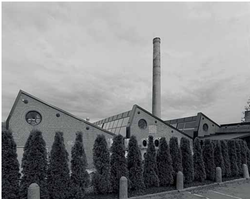
Norweska Akademia Kulinarna, Oslo The Culinary Academy of Norway, Oslo