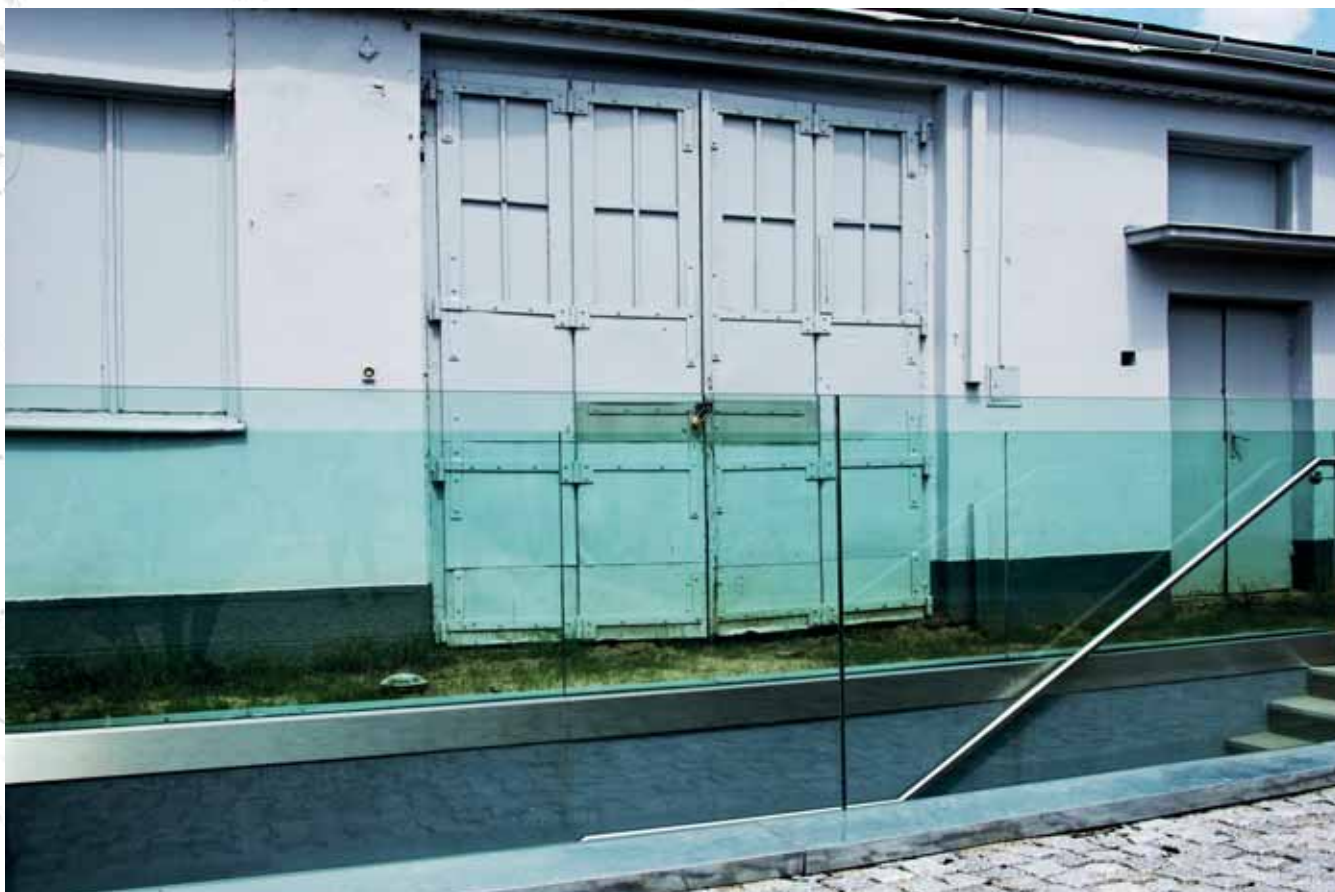
Muzeum Sztuki Współczesnej MOCAK, dawniej Fabryka Emalia Oskara Schindlera, Zabłocie, Kraków Museum of Contemporary Art MOCAK, former Oskar Schindler's Emalia Factory, Zabłocie, Kraków