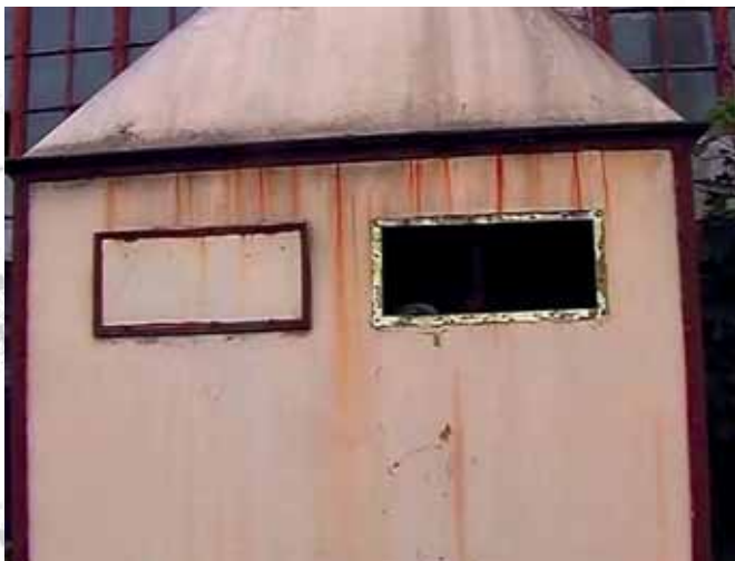
Zabudowania przemysłowe wzdłuż rzeki Akerselva, Oslo Post-industrial buildings alongside the Akerselva river, Oslo