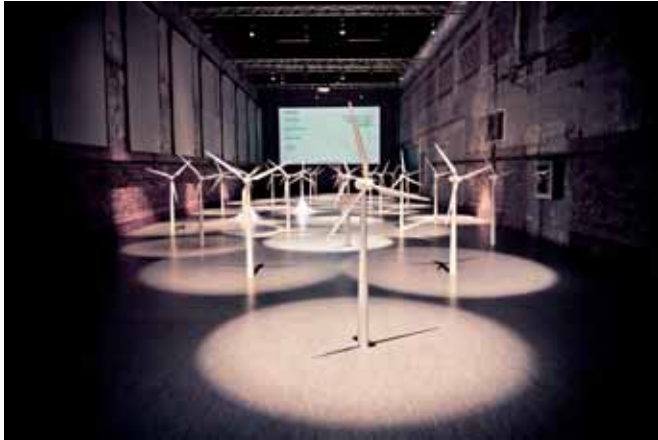
Centrum Architektury i Designu DogA, Oslo DogA – The Norwegian Centre for Design and Architecture, Oslo