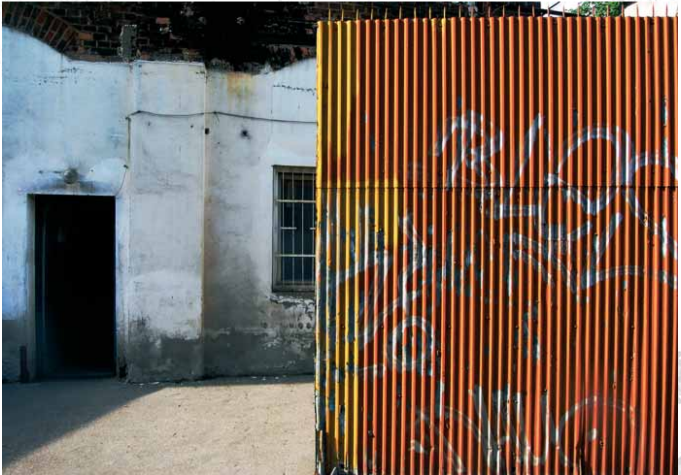
Fabryka Erdal, Kraków Erdal factory, Krakow