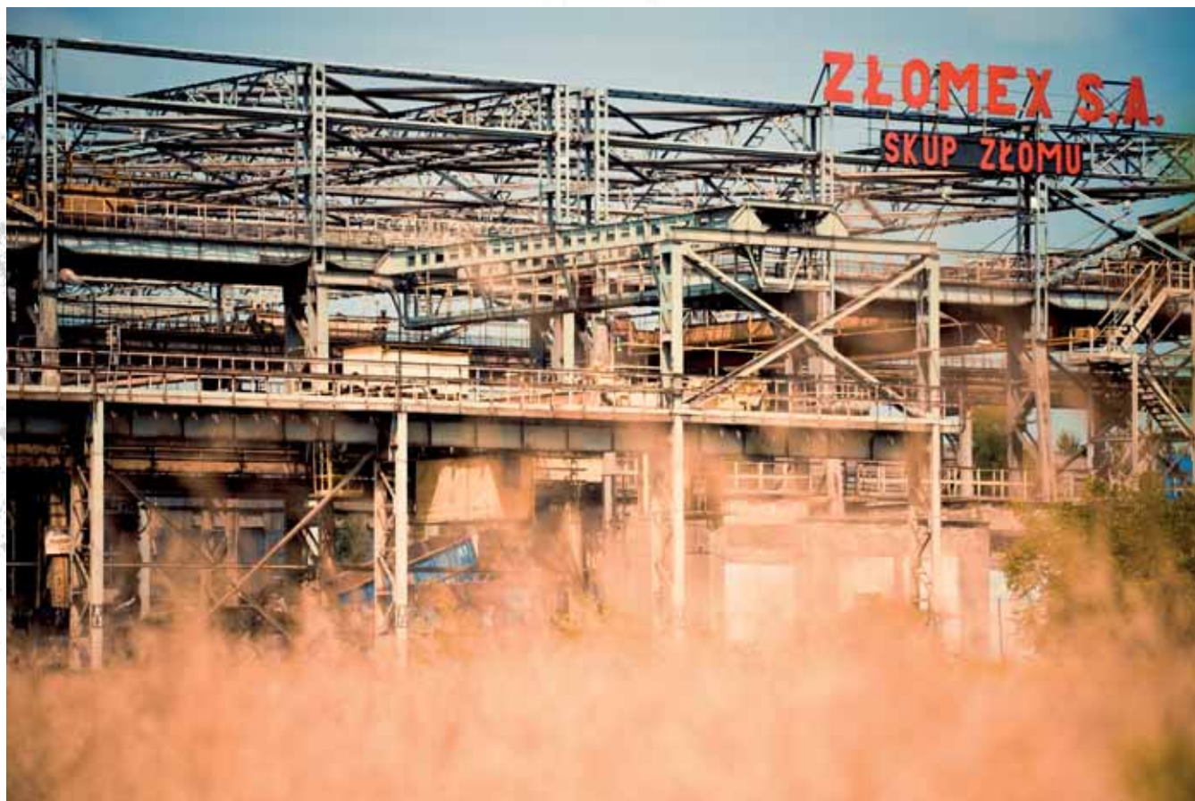
Złomex SA, Nowa Huta, Kraków Złomex Company, Nowa Huta, Kraków