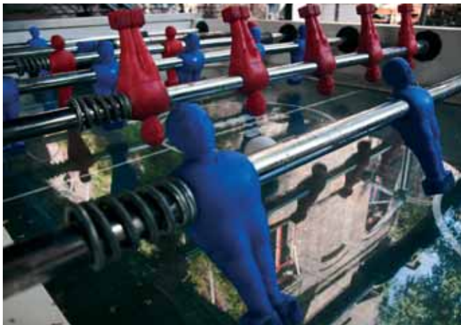
Månefisker Club, dawniej Hjula Væverier, Oslo Månefisker Club, former Hjula Væverier, Oslo