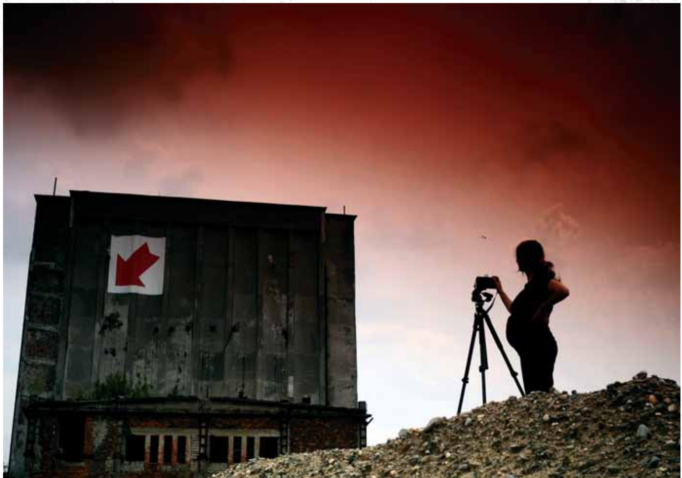
Prefabet, Nowa Huta, Kraków Prefabet Company, Nowa Huta, Kraków