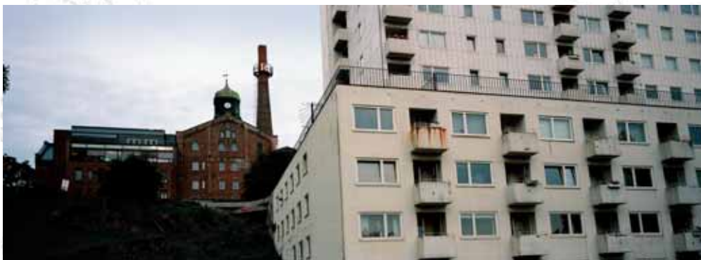
Stary browar, siedziba firmy Ringnes, Oslo Old brewery, seat of the Ringnes Company, Oslo