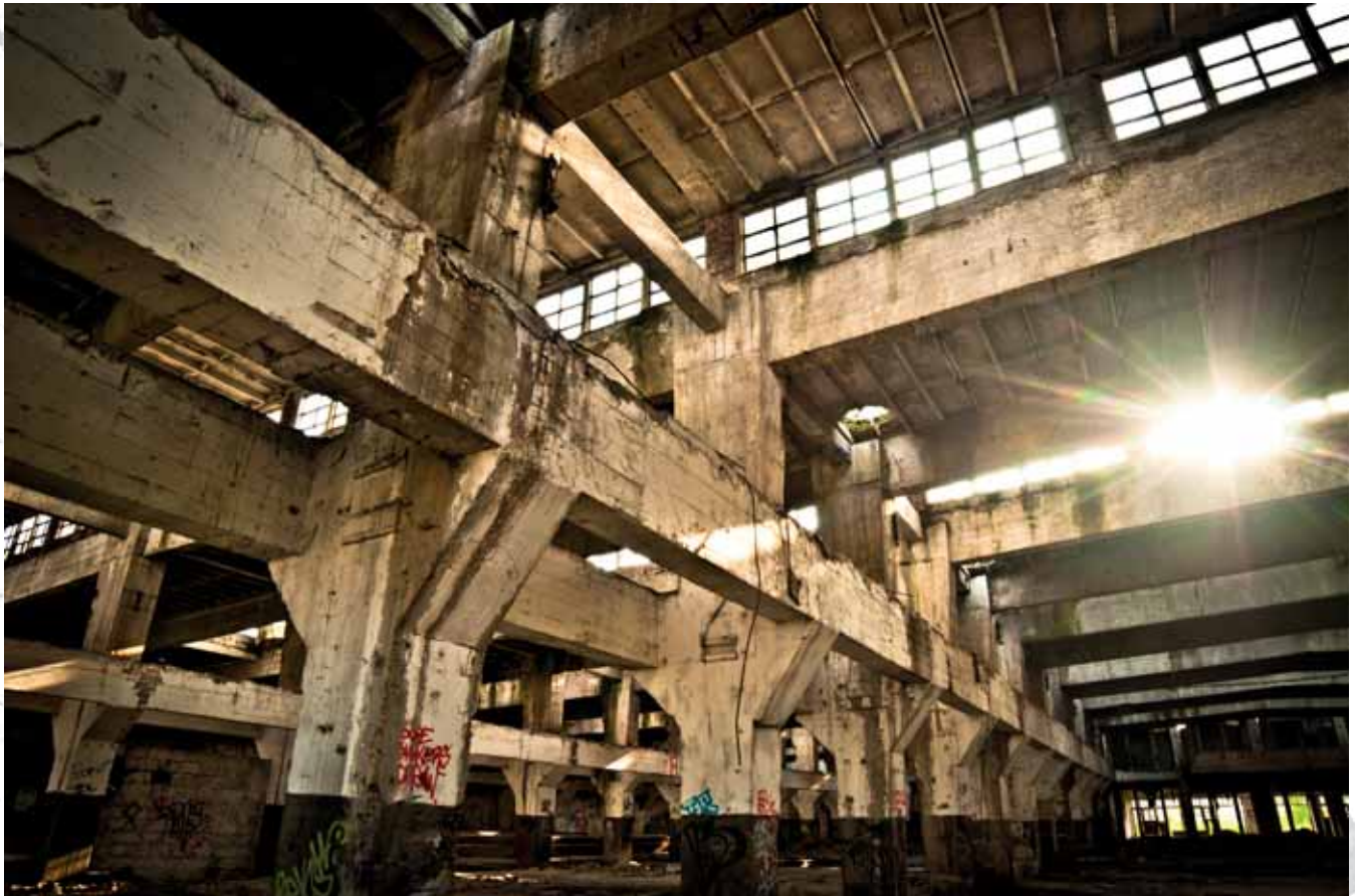
Prefabet, Nowa Huta, Kraków Prefabet Company, Nowa Huta, Kraków