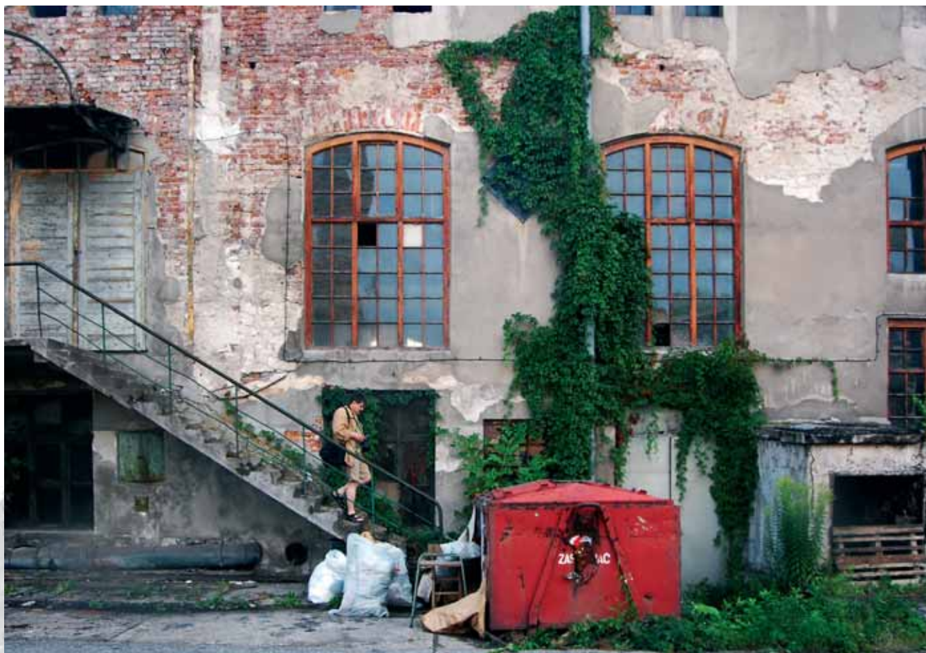
Fabryka Erdal, Kraków Erdal factory, Krakow