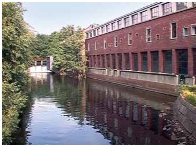
Myrens Verksted, dawne zakłady Jensen przy Akerselva, Nydalen, Oslo Myrens Verksted, former Jensen industrial plants nearby the Akerselva river, Nydalen, Oslo