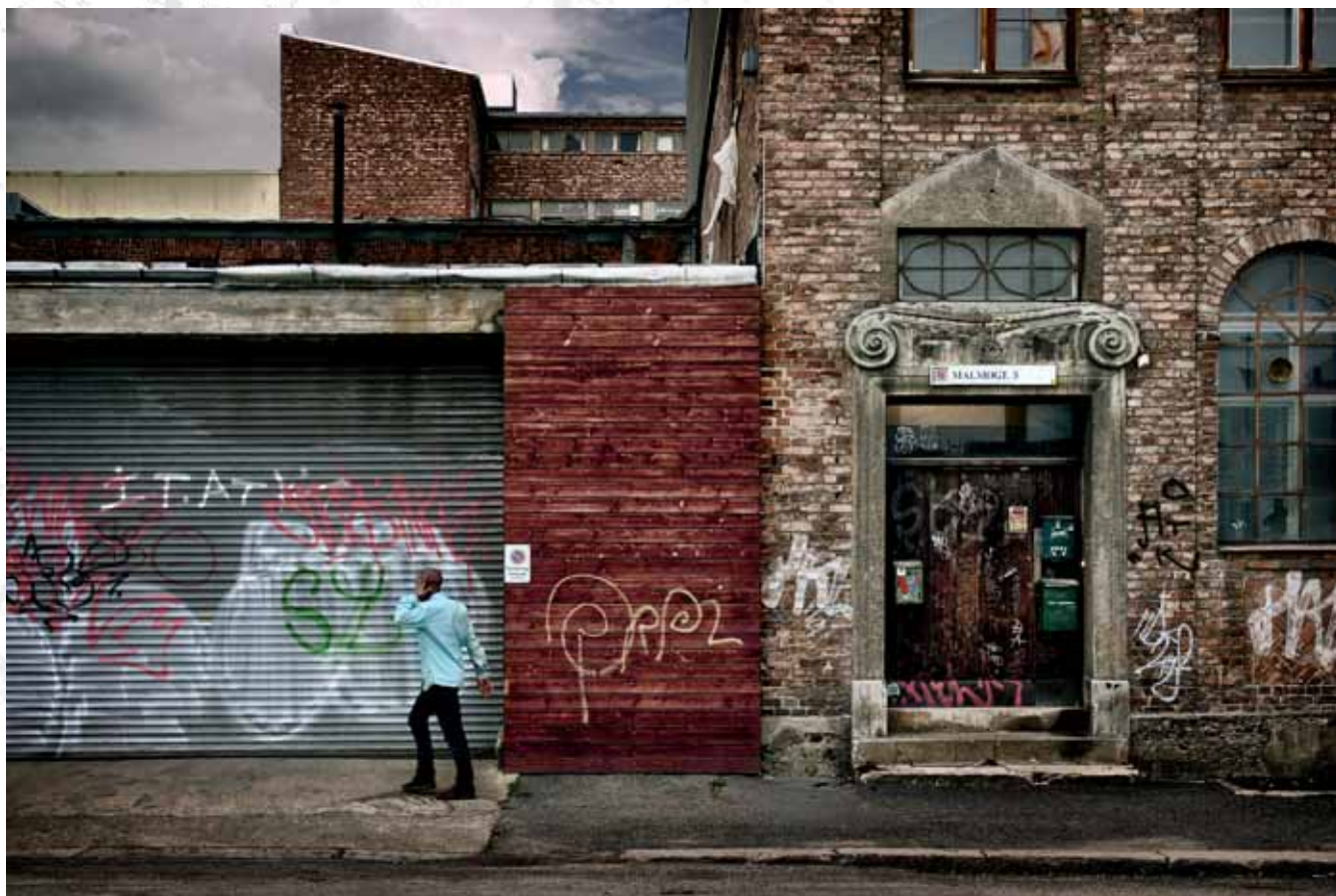
Okolice dawnej fabryki czekolady Freja, Oslo Surroundings of the former Freja chocolate factory, Oslo