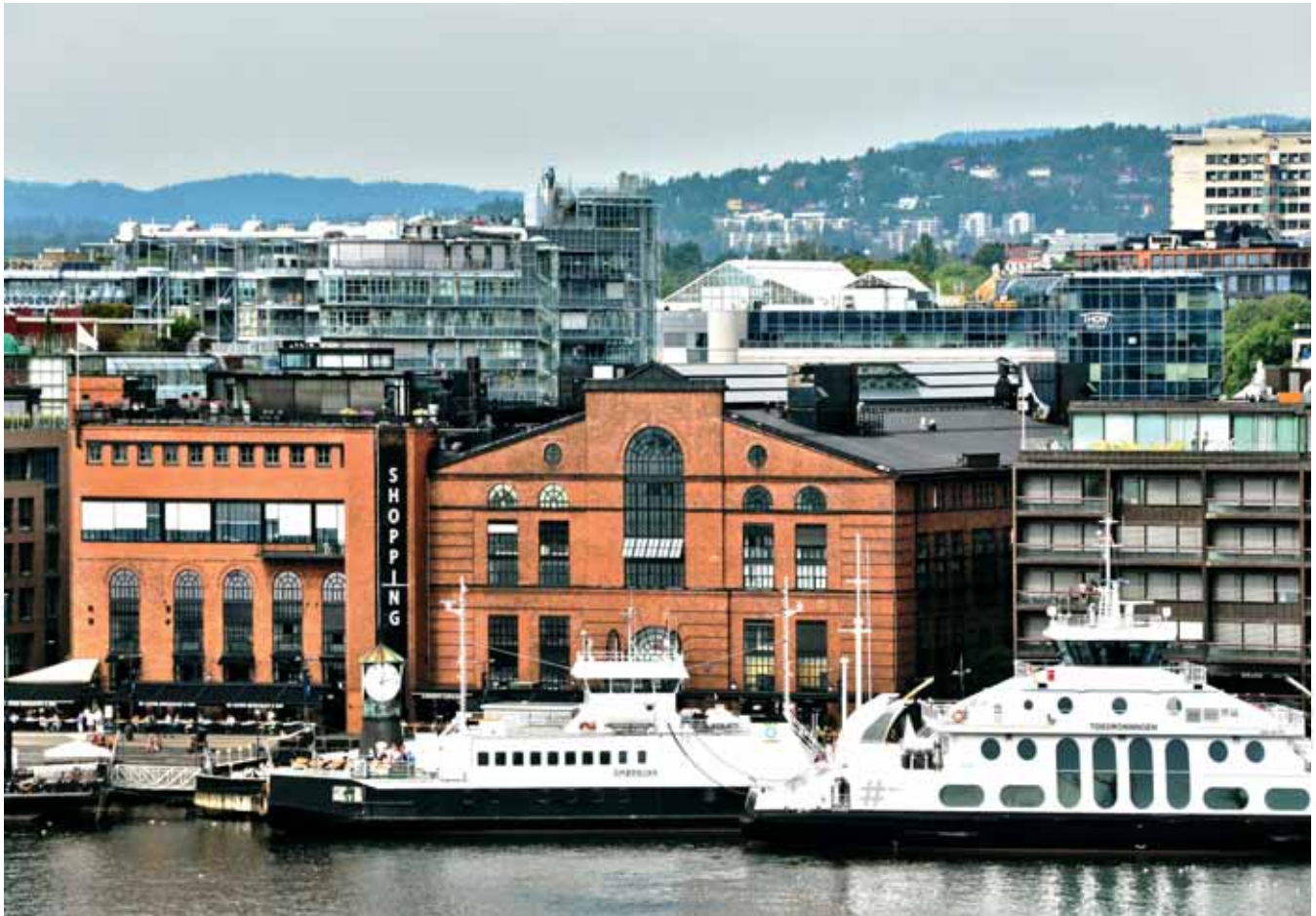
Aker Brygge, dawniej stocznia, Oslo Aker Brygge, former shipyard, Oslo