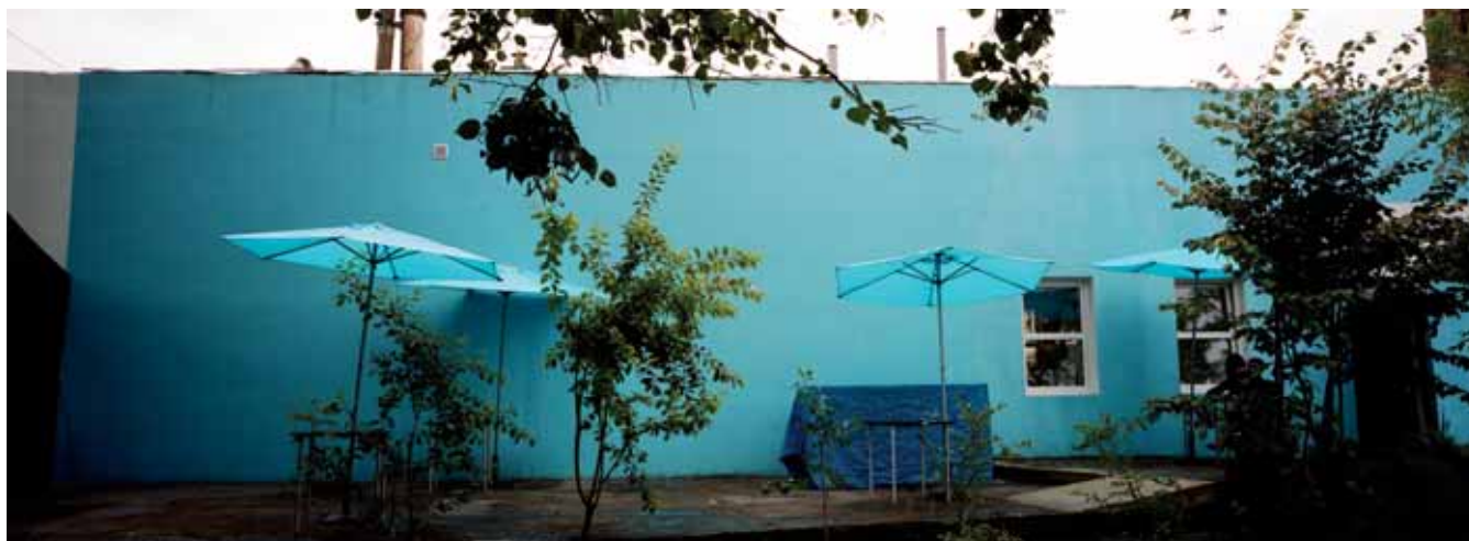
Ekobistro Papuamu, Zabłocie, Kraków Eco bistro Papuamu, Zabłocie district, Krakow