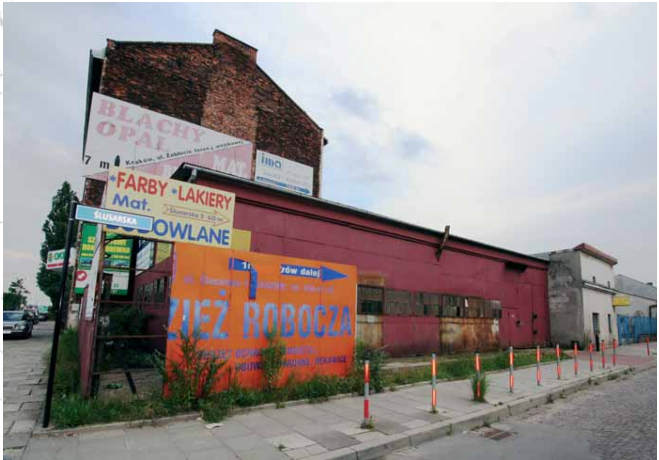
Blaszany warsztat, Zabłocie, Kraków Tin workshop, Zablocie district, Krakow