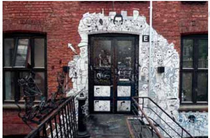
Kulturhuset Hausmania IV, dom kultury, Oslo Kulturhuset Hausmania IV, the cultural house, Oslo