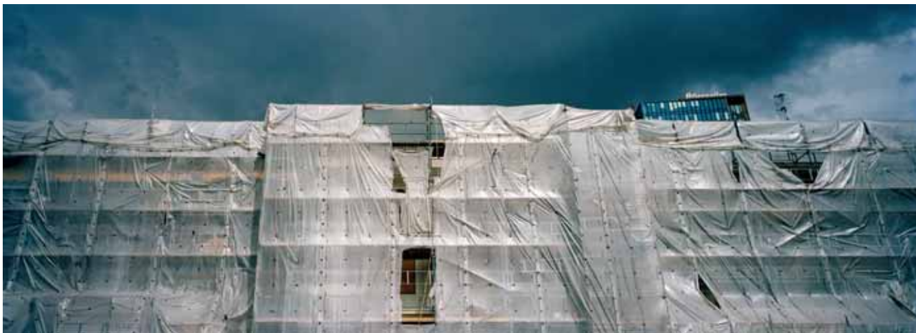
Dworzec Centralny, Oslo Central Station, Oslo