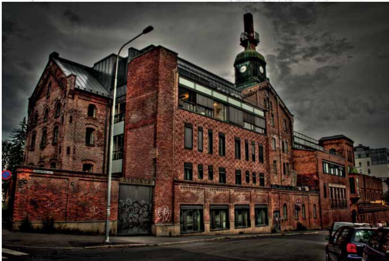
Stary browar, siedziba firmy Ringnes, Oslo Old brewery, seat of the Ringnes Company, Oslo